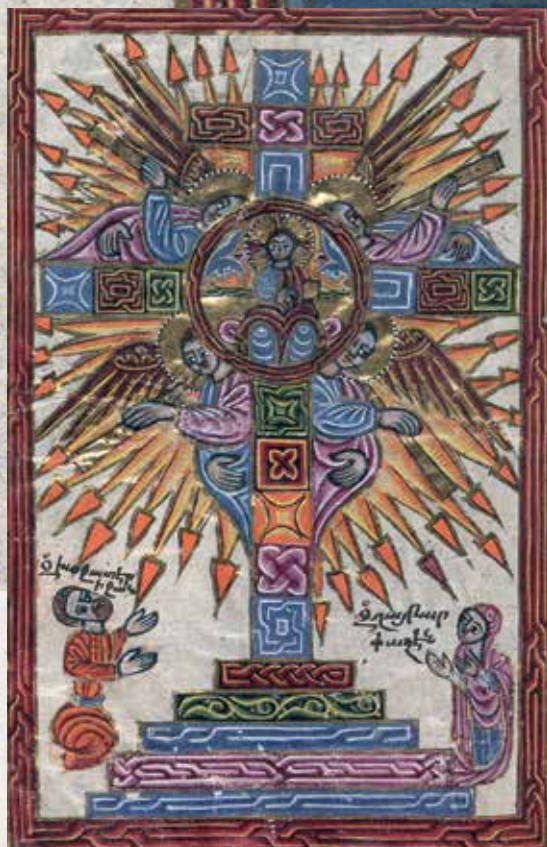
Évangélaire arménien, 1609, enluminure de Mesrop Khzanetsi. Oxford, Bodleian Library, Arm. d.13, v.22.