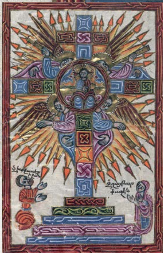
Évangélaire arménien, 1609, enluminure de Mesrop Khzanetsi. Oxford, Bodleian Library, Arm. d.13, v.22.