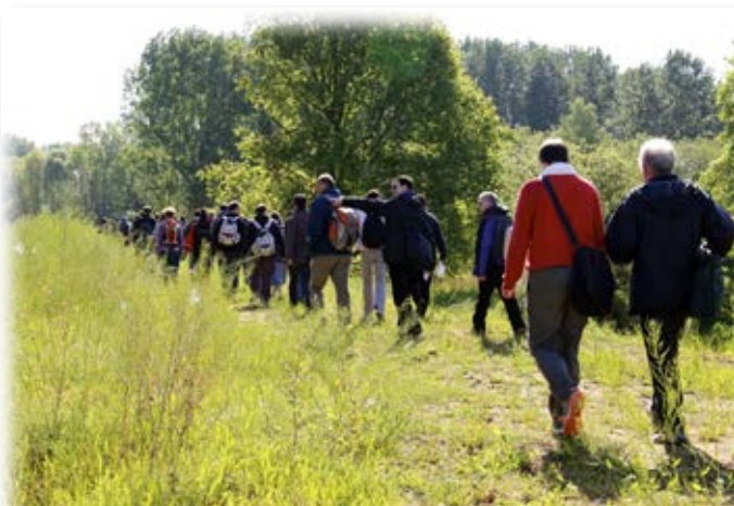
Pèlerinage marial

Ce Mystère est célébré quotidiennement à la chapelle de l'Institut dans l'Eucharistie qui rassemble professeurs et étudiants.